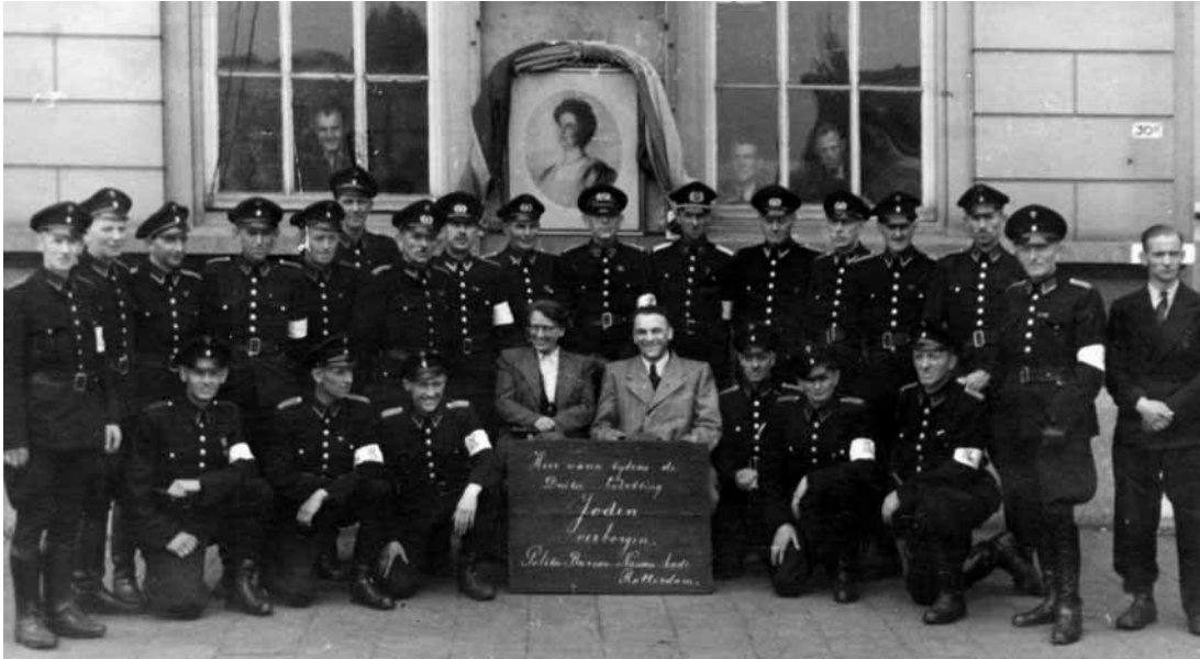
De beide joodse onderduikers tussen personeelsleden van het bureau Nassaukade zittend achter een houten bord waarop geschreven stond: 'Hier waren tijdens de Duitse bezetting Joden verborgen. Politie bureau Nassaukade Rotterdam'.