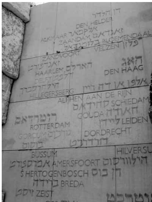
In de Vallei van de vernietigde gemeenschappen, gelegen op het terrein van Yad Vashem in Jeruzalem, zijn ook Rotterdam en Hillegersberg opgenomen.