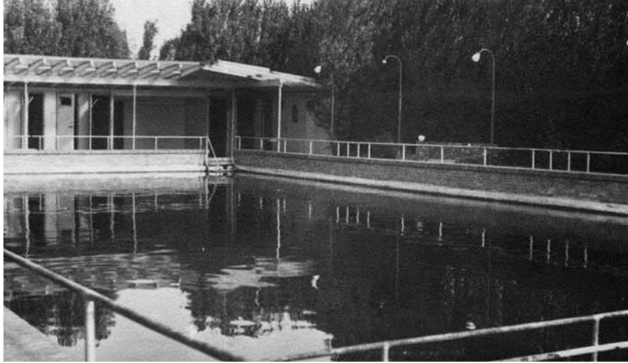
1944. Zwembad van het ontspanningsoord aan de Torenlaan in Overschie.